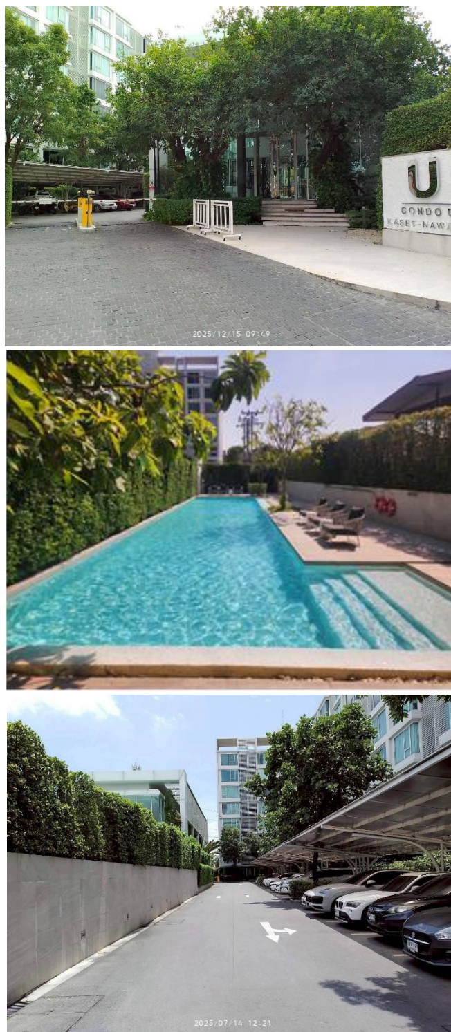
รูปที่ 1.4-1 แสดงสถานภาพปัจจุบันของโครงการ (ช่วงเดือนกรกฎาคม- ธันวาคม 2568)

โครงการ คอนโด ยู เกษตร-นวมินทร์ ได้เปิดดำเนินการแล้ว (ดังรูปที่ 1.4-1)